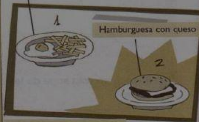
Filete de ternera con patatas