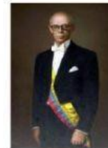
José María Velasco Ibarra