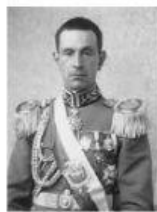
General Enriquez Gallo