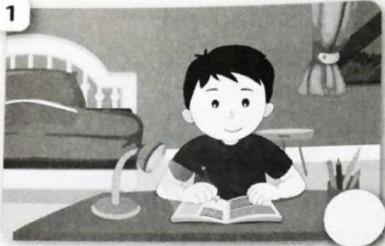
mengerjakan pr di kamar