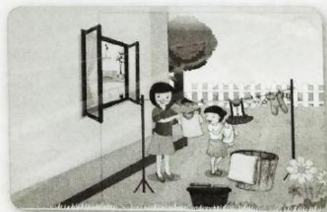
menjemur pakaian bersama

Lengkapilah kalimat berikut dengan kata-kata di dalam kotak!