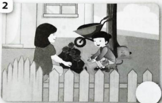
merawat tanaman bersama ibu