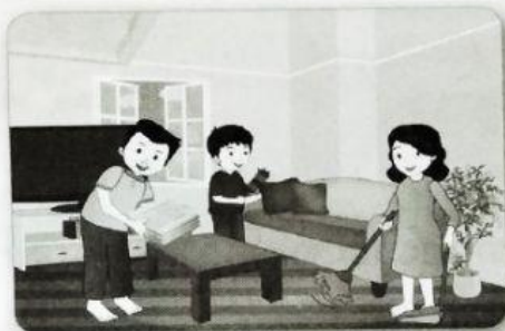
membersihkan rumah bersama