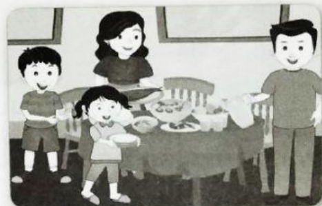
menyiapkan makan malam bersama