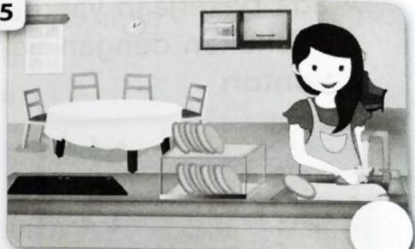
mencuci piring di dapur