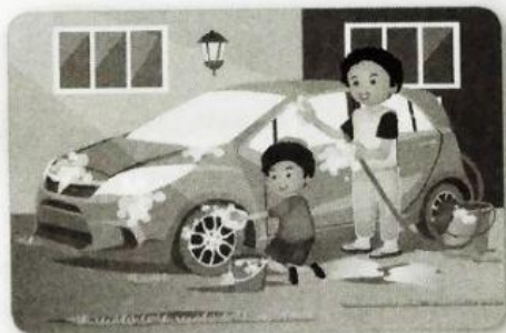
mencuci mobil bersama