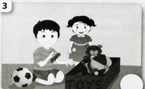
merapikan mainan bersama