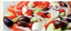
Großer Salat mit Schafskäse und Oliven 8,50