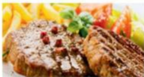
Steak in Pfeffersauce mit Pommes frites und Salat 16,90