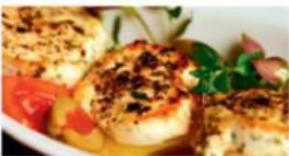
Gebackener Schafskäse mit Tomaten und Zwiebeln 7,50