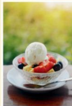
Obstsalat mit Eis 4,50