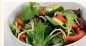
Kleiner gemischter Salat 4,50