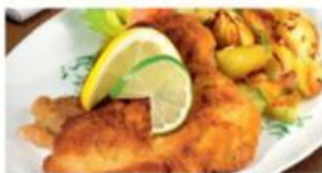
Schnitzel „Wiener Art“ mit Bratkartoffeln und Salat 12,90