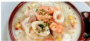
Französische Fischsuppe 8,00