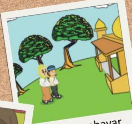
Pergi membayar zakat