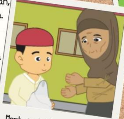
Memberi zakat kepada kaum du