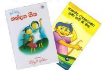
(சிறுவர் கவிதை புத்தகம்)

அப்போது சிறுவர் பாட்டுப் புத்தகங்கள் அதற்குரிய இராக்கைக்கு வரும்.