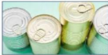
(a) Kaleng makanan