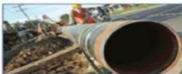
(c) pipa bawah tanah