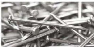
Gambar 1.