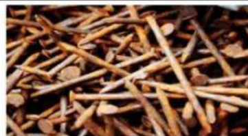
Gambar 2.