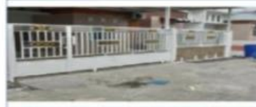
(b) pagar rumah