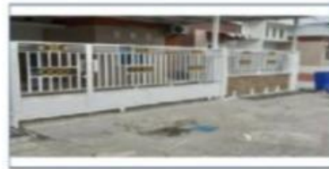
(b) pagar rumah