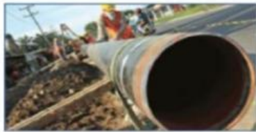
(c) pipa bawah tanah