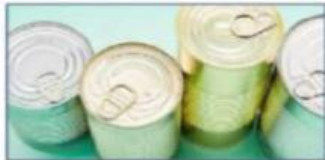
(a) Kaleng makanan