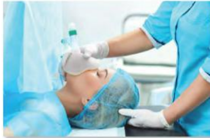
2 La anestesia general .....