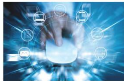
7 Internet .....