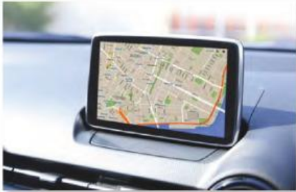
1 El GPS .....

Ucrania • Japón • Gran Bretaña • China • Rusia • Suecia • Estados Unidos • La India