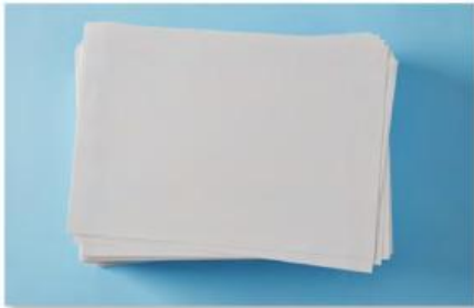
5 El papel .....