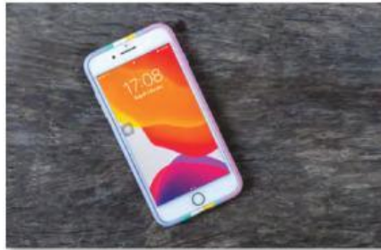
6 El teléfono móvil .....