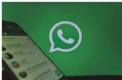
8 WhatsApp .....

4 B ¿Puedes añadir algún invento de tu país a la lista anterior? Coméntalo con tu compañero.