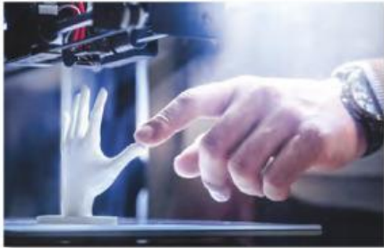
3 La impresora 3D .....