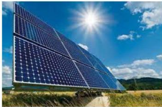
Gambar 1 : Sumber energi masa depan

Sel elektrokimia adalah sel yang mengubah energi kimia menjadi energi listrik ( Sel Volta ) atau sebaliknya energi listrik menjadi energi kimia ( Sel Elektrolisis ). Sel elektrokimia terdiri dari dua elektroda, yaitu katoda dan anoda, yang dipisahkan oleh larutan elektrolit. Pada baterai dan aki, reaksi kimia yang terjadi di dalam sel elektrokimia menghasilkan arus listrik.