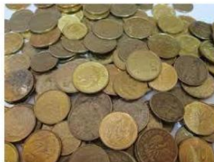
Gambar : Oksidasi pada logam

Elektrolisis adalah proses kimia yang mengubah energi listrik menjadi energi kimia, dimana terjadi .penguraian suatu elektrolit oleh arus listrik. Komponen yang terpenting dari proses elektrolisis ini adalah elektrode dan larutan elektrolit. Pada sel elektrolisis, reaksi kimia akan terjadi jika arus listrik dialirkan melalui larutan elektrolit,yaitu energi listrik ( arus listrik) diubah menjadi energi kimia (reaksi redoks).