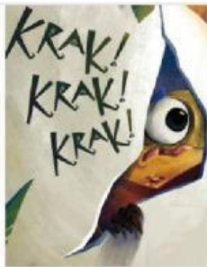
Krak! Krak! Krak! Jenjang 2 Penulis Benny Rihandani Ilustrator Wastana Halikal Penorbit Room to Read