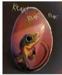
Lalu, ia mendengar sesuatu