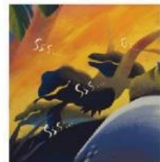
Aduuuu, suara mereka juga makin menyeramkan.