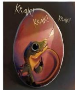
Lalu, ia mendengar sesuatu.