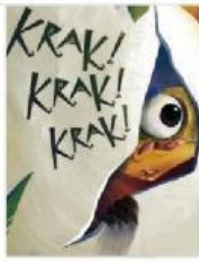
Krak! Krak! Krak! Jenjang 2 Penulis Penny Ruseffendi Sutrisno Wastana Makul Penerbit Rineke Cipta