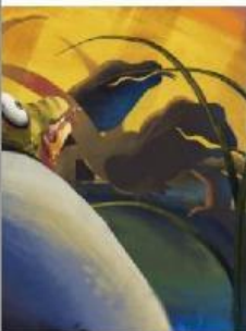
Aaaa, mereka mendekati Bayi Komodo!