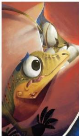
Ada sesuatu yang menggeliat (bergerak) di sana