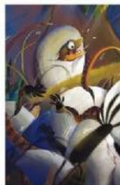
Bayi Komodo terkejut