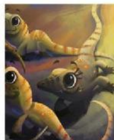
Tapi, tunggu! Mereka tidak menyeramkan