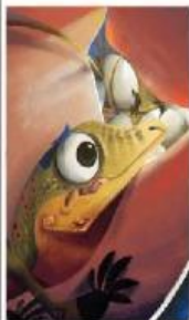
Ada sesuatu yang bergerak-gerak di sana