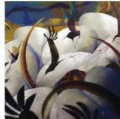
Oh, tidak! Mereka sangat banyak!