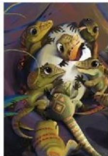
Tapi, kepala bayi Komodo malah tersangkut.