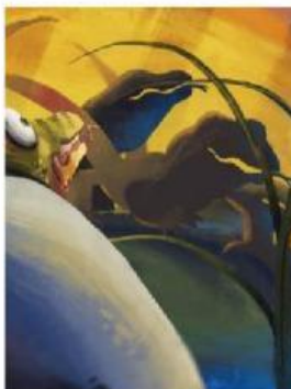
Aaaa, mereka mendekati Bayi Komodo!