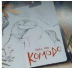
Komodo adalah kadal purba yang langka