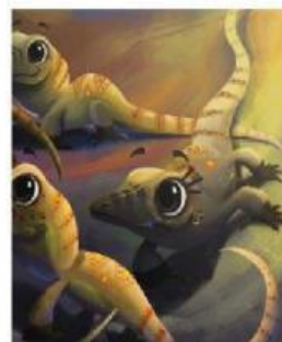
Tapi, tunggu! Mereka tidak menyeramkan.