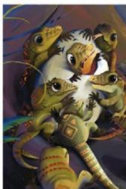
Tapi kepala bayi Komodo malah tersangkut