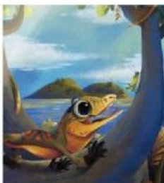
Sekarang, Bayi Komodo sudah menetas