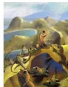
Mereka adalah saudara Bayi Komodo