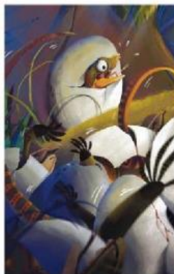
Bayi Komodo terkejut