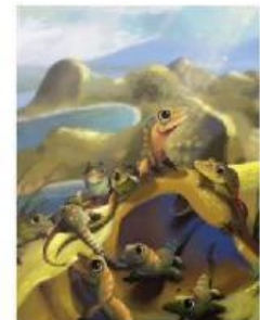
Mereka adalah saudara Bayi Komodo