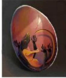
Bayi Komodo terbangun setelah tidur panjang Ia tertidur selama delapan bulan.