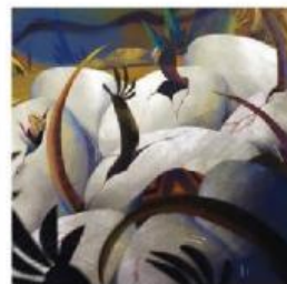
Oh, tidak! Mereka sangat banyak!