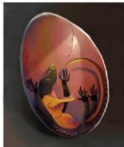
Bayi Komodo terbangun. Setelah tidur panjang hampir selama delapan bulan.