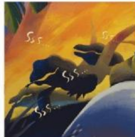
Aduuuh, suara mereka juga makin menyeramkan.