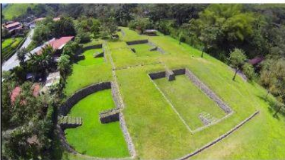
MUSEO DE TULIPE

3.- Identifique los siguientes sitios arqueológicos y ubique el nombre correcto.