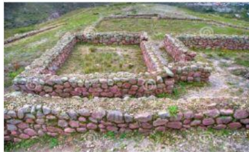
RUINAS DE COCHASQUI