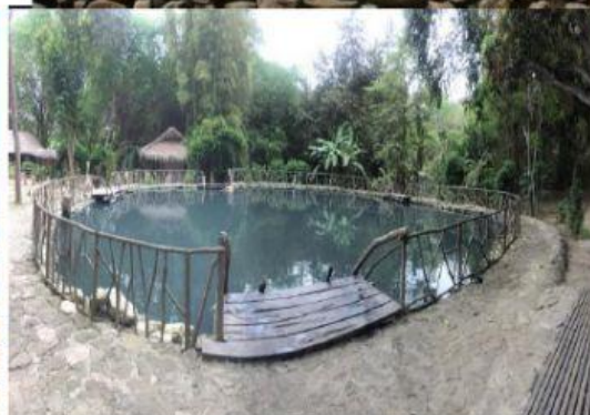
COMPLEJO DE PUMAPUNGO

4.- Una la imagen con el nombre de la Ruina Arqueológica