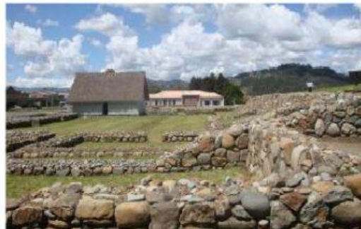
RUINAS DE RUMICUCHO