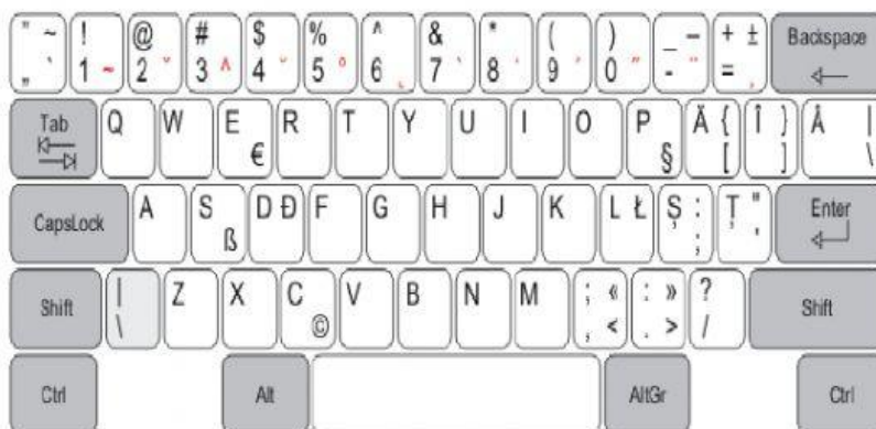
Aranjamentul primar din noul standard SR 13992:2004 (varianta „standard” in noul layout xkb)