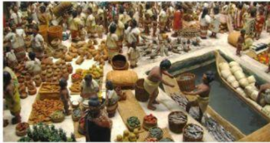
"Mercado de Tenochtitlán". Representación del Museo de Historia Natural de Chicago.

Observa la imagen y responde la pregunta 4.