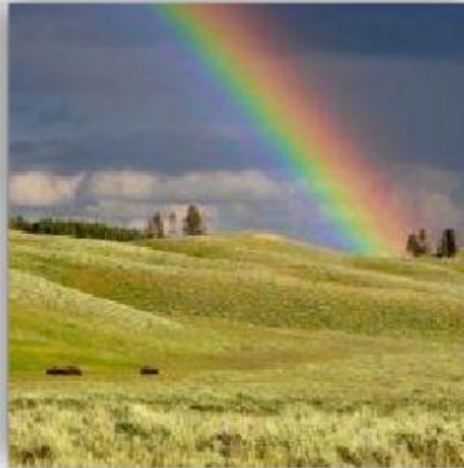
Gambar 2. Pelangi