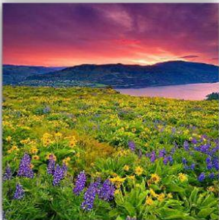
Gambar 1. Pemandangan Alam