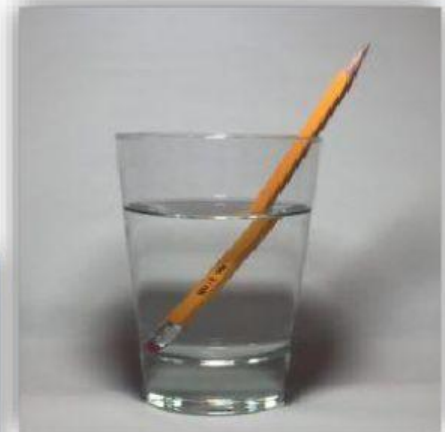
Gambar 3. Pensil dalam gelas berisi air