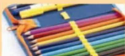
Die Federtasche(n) = das Federmäppchen(-)