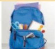
Die Schultasche(n) Der Rucksack("e)