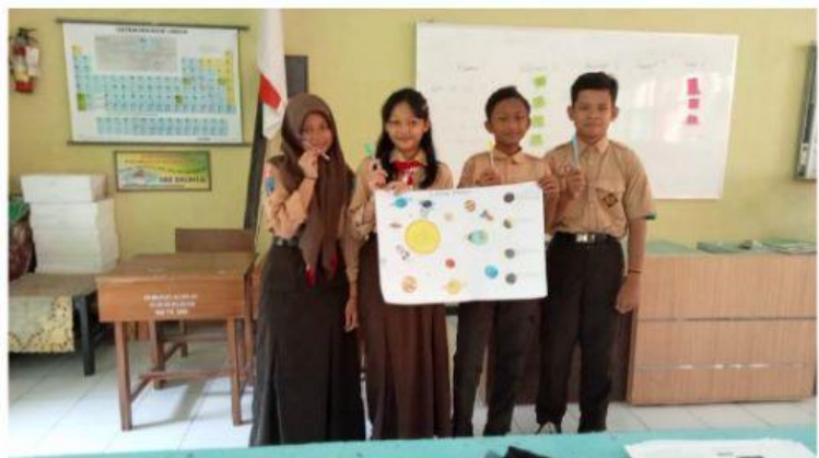
KELOMPOK VISUAL ( Poster )