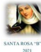
SANTA ROSA "B" 2021