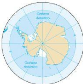
OCÉANO GLACIAL ANTÁRTICO