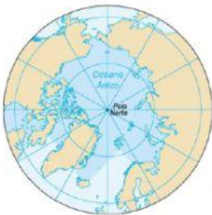
OCÉANO GLACIAL ÁRTICO