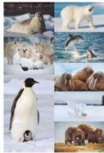
Fauna de alta montaña