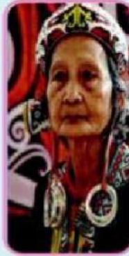
Gambar 1.21. Perempuan dari suku Dayak

Untuk membaca materi lebih lengkap silahkan baca disini