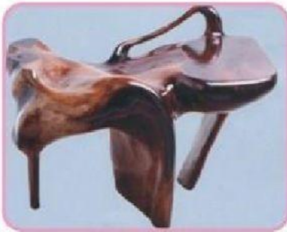
Produk kerajinan terbuat dari bahan kayu. Fungsinya sebagai kursi, tapi bentuknya sudah dirubah sehingga tidak menyerupai kursi yang sebenarnya.

Manusia sebagai insan senantiasa mendambakan kehidupan yang humanis, suatu kehidupan yang laras, menyenangkan lahir dan batin. Manusia dengan segala pengalamannya akan selalu mendahulukan kebahagiaan dan kenyamanan. Untuk beberapa orang kebahagiaan itu menjadi dambaan dan akan sangat sadar bahwa tiap orang berhak atas kebahagiaan itu. Di sepanjang perjalanan sejarah peradaban itu, manusia memperlihatkan ketergantungannya pada kebendaan. Bagai daun dan tangkainya, bahwa keduanya tak dapat dipisahkan, bahkan keduanya merupakan perpaduan yang erat dan sulit untuk diabaikan. Pertalian yang erat ini terkadang ditandai dengan latar belakang budaya. Maka sangat beralasan jika dalam memenuhi kebendaan, manusia berkaitan erat dengan tujuan agar dapat menjamin tingkat kepuasan pemakainya. Demikian pula terhadap strategi perubahan bentuk untuk produk kerajinan. Tentunya hal mendasar di atas sangat mempengaruhi terbentuknya rancangan baru yang mengarah kepada tingkat kepuasan manusia itu sendiri. Selain dengan cara menyederhanakan bentuk, kerajinan berbasis media campuran dapat pula dilakukan dengan menggunakan cara merubah bentuk hingga menjadi bentuk yang benar benar baru. Hal ini sejalan dengan keinginan manusia yang mengarah kepada tujuan jangka panjang. Deformasi diartikan sebagai perubahan bentuk yang terjadi secara permanen. Perubahan bentuk ini harus diimbangi dengan pengetahuan tentang objek atau produk asalnya, agar perubahan yang diharapkan dapat terlihat dengan maksimal.