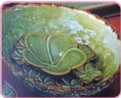
Produk kerajinan berbasis media campuran. Karya ini terbuat dari keramik, fungsinya sebagai mangkuk, tapi bentuknya sudah diubah terutama pada bagian dekorasi bagian dalamnya, sehingga tidak maksimal berfungsi sebagai mangkuk.