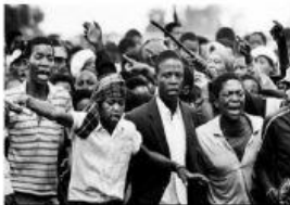
Perjuangan Perang Dingin