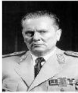
Joseph Broz Tito, Pendiri Yugoslavia