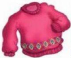
A malha ou O moletom ou O casaco

2. Aprenda o nome das roupas em português.