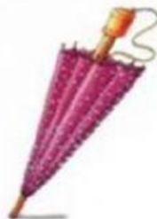
O guarda- chuva