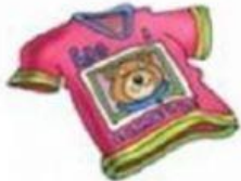
A camiseta t-shirt