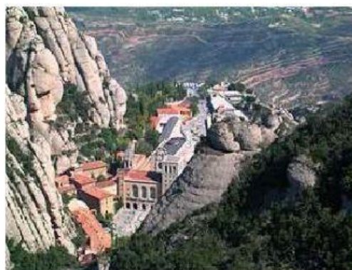
Monasterio de Montserrat

La pintura, la danza, el teatro y en especial todas las artes despertaban muchas suspicacias y reticencias entre las religiosas de la Edad Media, hasta el punto de que durante mucho tiempo estuvieron prohibidas en el de las . Pero la necesidad de elaborar un visual que permitiera evangelizar al pueblo iletrado condicionó la aparición y el desarrollo de , danzas, y obras de teatro sobre historias de la , tanto del Antiguo como del Nuevo . Así, por ejemplo, los