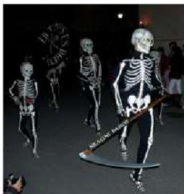
Danza de la muerte, Verges

monjes de la Abadía de Montserrat elaboraron el Libre Vermell de Montserrat, que incluía una de cantos y danzas coreografiadas para de los durante las veladas nocturnas y diurnas en la de delante de la iglesia de Montserrat.