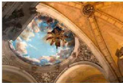
Misterio de Elche

1. Las representaciones religiosas. El teatro nace de los litúrgicos: frases de los textos litúrgicos*; con especial relevancia durante dos festividades: la Pascua y la . Estas manifestaciones evolucionan hacia formas como los milagros , los misterios o los autos sacramentales ; y con el tiempo se añadirán temas nuevos como los de la de la Virgen María o las vidas de los . Cuando empezaron a incorporarse escenas , expresiones hoscas y gestualidades provocativas, el teatro tuvo que las iglesias y salir a las . El mismo destino siguieron las : si al principio se representaban en los templos, con el paso del tiempo se vuelven más profanas y son fuera de los recintos sagrados. Se consideran también como representaciones religiosas las de la (de tono más popular y satírico; se todas las clases sociales, incluido el clero) y el teatro procesional encima de , típico de la festividad del Corpus.