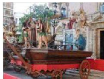
Carros del Corpus de Valencia