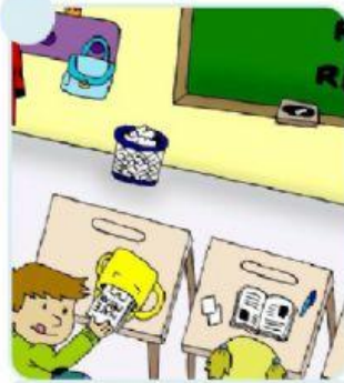
Saca los libros