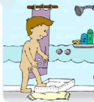
Entra en la ducha