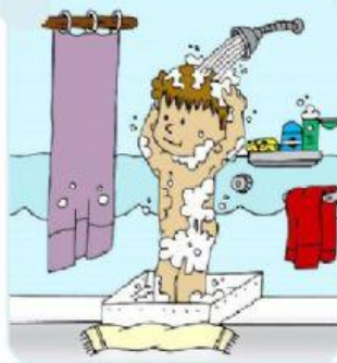
Se lava bien