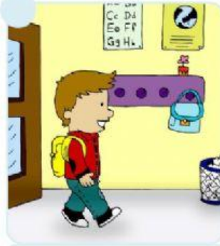
Entra en clase