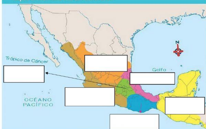
Mapa 1.2 Áreas culturales de Mesoamérica

3. El desarrollo de las culturas mesoamericanas es largo y complejo. Para estudiarlo, se ha dividido en tres periodos: Elige que periodo corresponde de acuerdo con las fechas en la línea del tiempo.