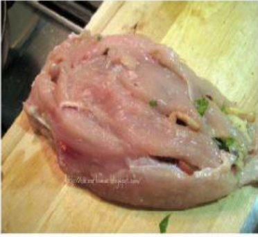
PELÍCULA BABOSA Y OLOR