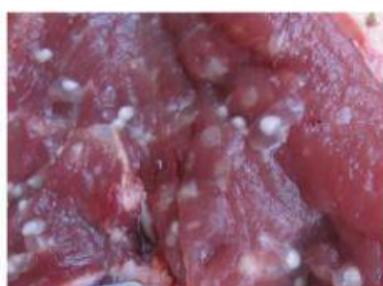
COLOR TIRANDO A MARRÓN O VERDOSO, OLOR A PODRIDO.