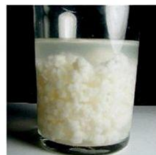
COLOR AMARILLO VERDOSO, SABOR AGRIO