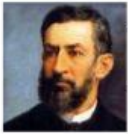
Juan León Mera

De pensamiento Liberal y anticlericalista, fue enemigo de Gabriel García Moreno y de Ignacio de Veintemilla. Escribió “Las Catilinarias contra Veintemilla”, huyó a Panamá donde conoce a Eloy Alfaro.