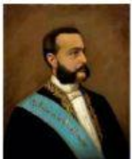
José María Plácido Caamaño

Fortalecer la intervención del Estado en la economía con una moneda propia: el sucre . Impulsar las obras públicas, la salud y la educación.