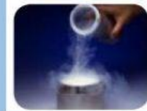
Oxígeno y nitrógeno