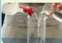
Agua con alcohol