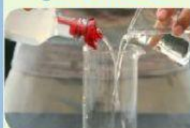
Agua con alcohol