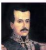
José María Urbina