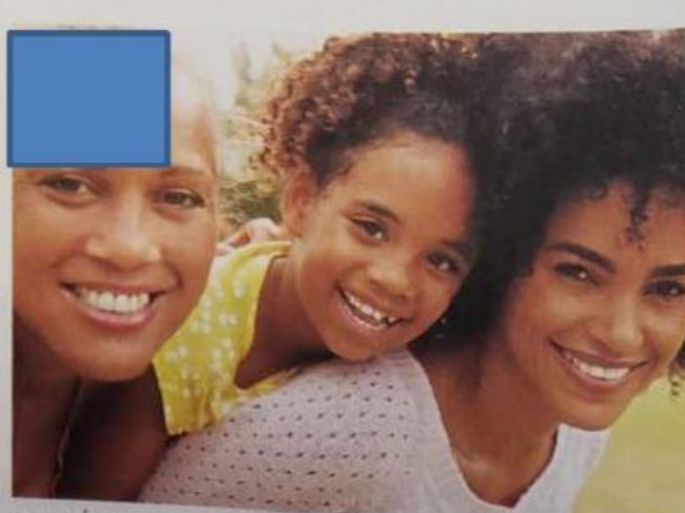
FAMÍLIA FORMADA POR AVÓ, MÃE E NETA.

5) SOBRE AS MORADIAS FAÇA O QUE SE PEDE: