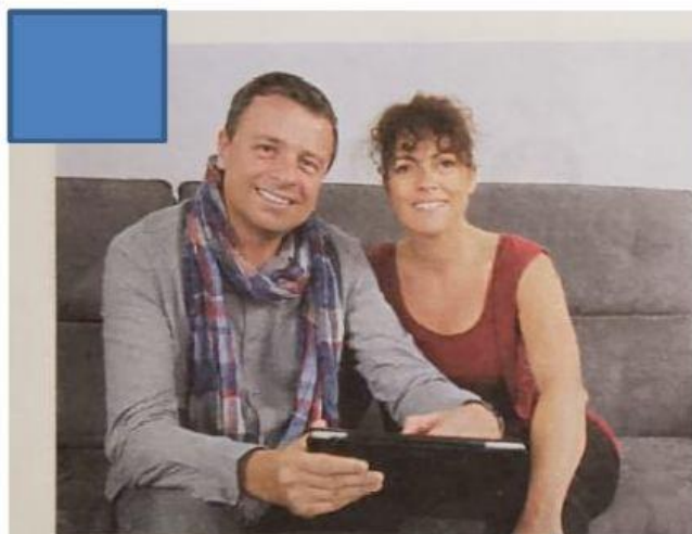
FAMÍLIA FORMADA POR CASAL SEM FILHOS.

4) OBSERVE AS IMAGENS ABAIXO E MARQUE NO QUADRADO QUANTOS MEMBROS FORMAM CADA FAMÍLIA: