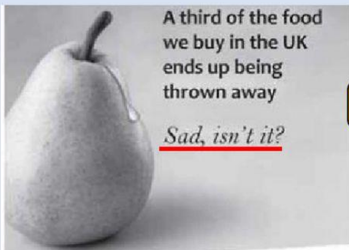
imagem para as questões 5 e 6

5) A tradução da parte da frase destacada em vermelho é: