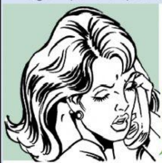
Imagem para a questão 2

I am running out of excuses. So I will tell you the truth: I don't want to talk to you anymore.