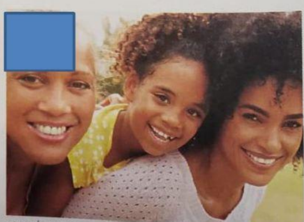
FAMÍLIA FORMADA POR AVÓ, MÃE E NETA.