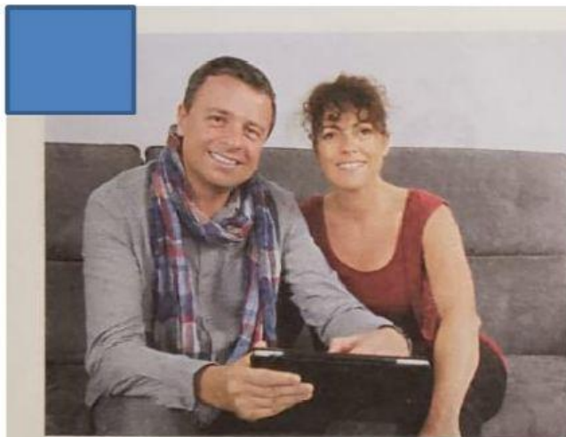
FAMÍLIA FORMADA POR CASAL SEM FILHOS.

5) Observe as imagens abaixo e marque no quadrado quantos membros formam cada família: