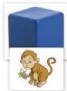
EN FACE/ DEVANT