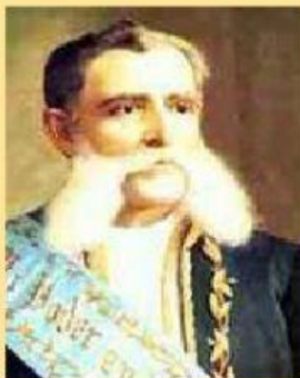
José María Plácido Caamaño