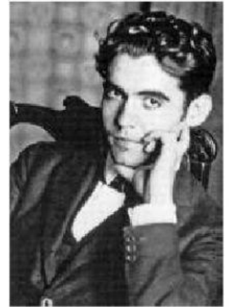
Federico García Lorca