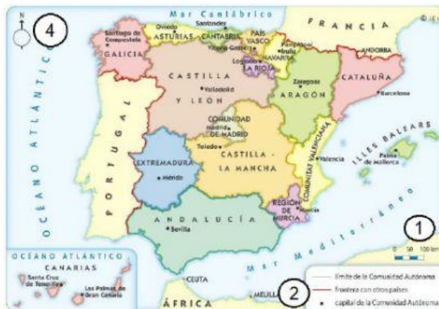
Mapa de las Comunidades Autónomas de España (3)

Escribe el número que le corresponde a cada elemento del mapa: