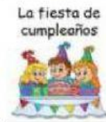
La fiesta de cumpleaños