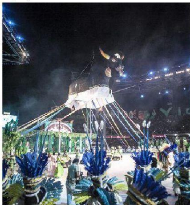
Festival folclórico de Parintins.

As manifestações religiosas e culturais brasileiras apresentadas nas imagens: