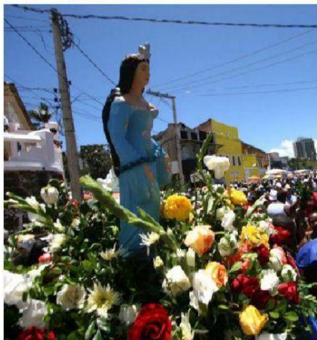
Festa de Iemanjá.