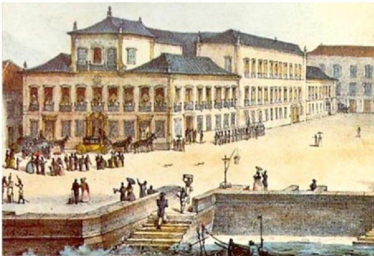
Detalhe da pintura Vista da Paço Imperial no Rio de Janeiro , produzida por volta de 1830 pelo artista francês Jean-Baptiste Debret.

O Paço Imperial, construído no século XVIII (mais precisamente em 1753) na cidade do Rio de Janeiro, sempre foi, desde sua concepção, um edifício ligado exclusivamente ao poder régio, ou seja, dos reis. Com a queda da monarquia do poder, o imperioso edifício se tornou sede dos Correios. Foi tombado, isto é, reconhecido como patrimônio material, em 1938. Desde 1985 é um centro cultural, que recebe shows e exposições com entrada gratuita. Com o tombamento, sua fachada, ou seja, a parte externa da construção, deve permanecer inalterada, preservando as características de sua arquitetura original.