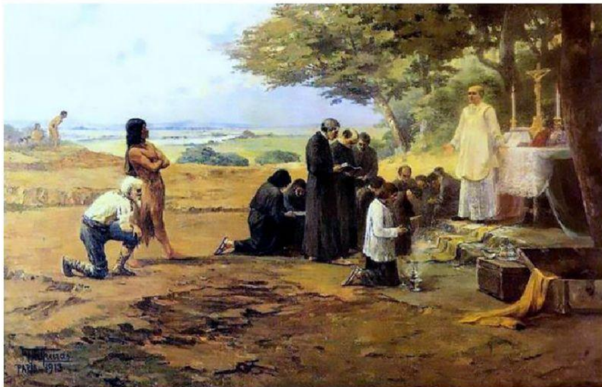
Fundação de São Paulo , obra de Antônio Parreiras, 1913.

De acordo com a pintura, que foi produzida em 1913, é possível afirmar que: