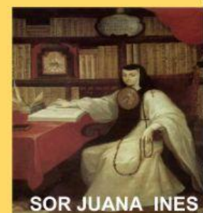
SOR JUANA INES