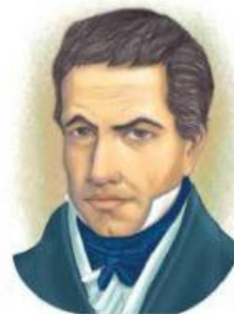
JOSÉ MARÍA LUIS MORA