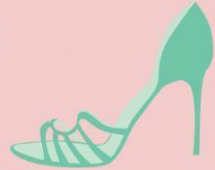
scarpa col tacco