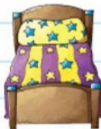
El largo de mi cama