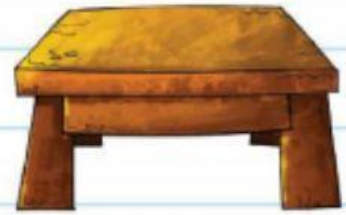
El largo de una mesa