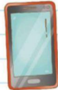
El largo de un celular