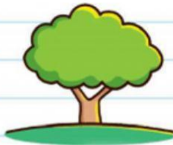
La altura de un árbol