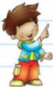
La altura de mi amigo