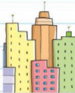
La altura de un edificio