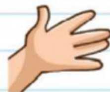
El largo de mi mano