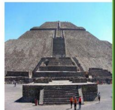
Pirámide del sol