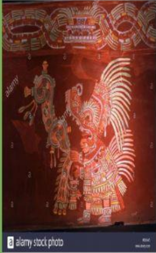
Pirámide de la luna

Relaciona con una línea cada figura con su nombre.