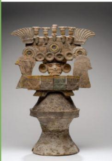
Brasero o incensario tipo "teatro"