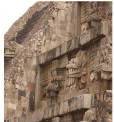
Frente de pirámide de la serpiente