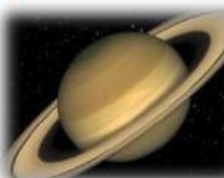
S A T U R N O

Planeta más pequeño del sistema planetario solar y el que está más cerca del Sol.