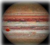
J Ú P I T E R

Su superficie es de aspecto azul por la presencia del gas metano.