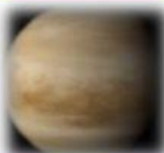
V E N U S

Es el planeta más grande del sistema planetario solar.