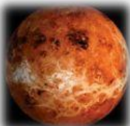
M E R C U R I O

9. Identifica la información que le corresponde a cada planeta y relaciona la columna de la derecha con la de la izquierda.