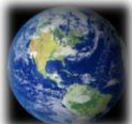
T I E R R A

Tiene la atmósfera más fría del sistema solar.