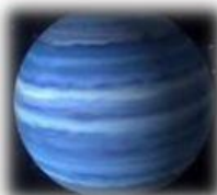
N E P T U N O

Es el único planeta que tiene agua en su superficie.