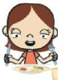
HORA DE JANTAR