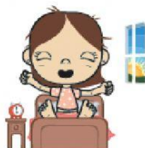
HORA DE ACORDAR