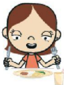
HORA DE ALMOÇAR