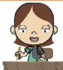
HORA DE ESTUDAR