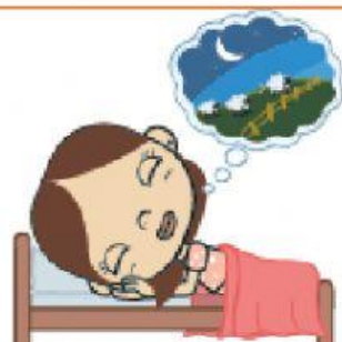
HORA DE DORMIR