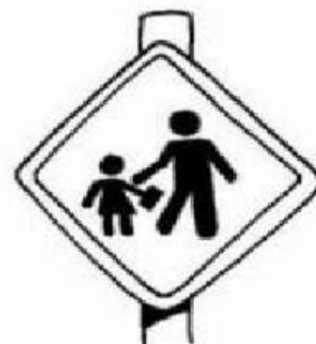
Área escolar próxima

LIGUE CORRETAMENTE OS NOMES DAS CORES AO SIGNIFICADO.