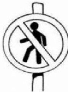
Proibido trânsito de pedestre