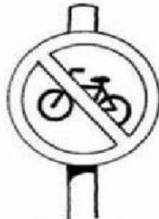
Proibido trânsito de bicicleta

Servem para orientar os motoristas e os pedestres.