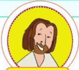
JESÚS DE NAZARET

Hoy vamos a conocer un poco más sobre la persona de Jesús de Nazaret.