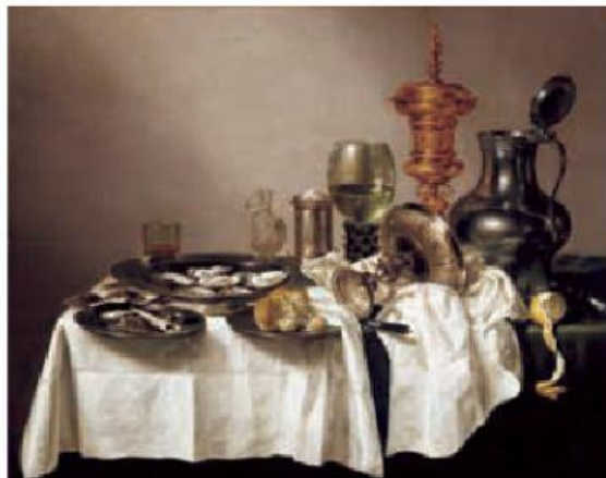
Willem Claesz Heda, Naturaleza muerta con copa dorada

En clase doblen una hoja sobre su eje horizontal (la parte más angosta), posteriormente en el primer espacio dibujen un objeto simple que tengan a su alcance, recuerden que deben prestar atención en la luz que cae en el objeto, éste puede ser un cuaderno, lápiz o una manzana, traten de ser conscientes de la sensación y la emoción que les causa la luz sobre el objeto.