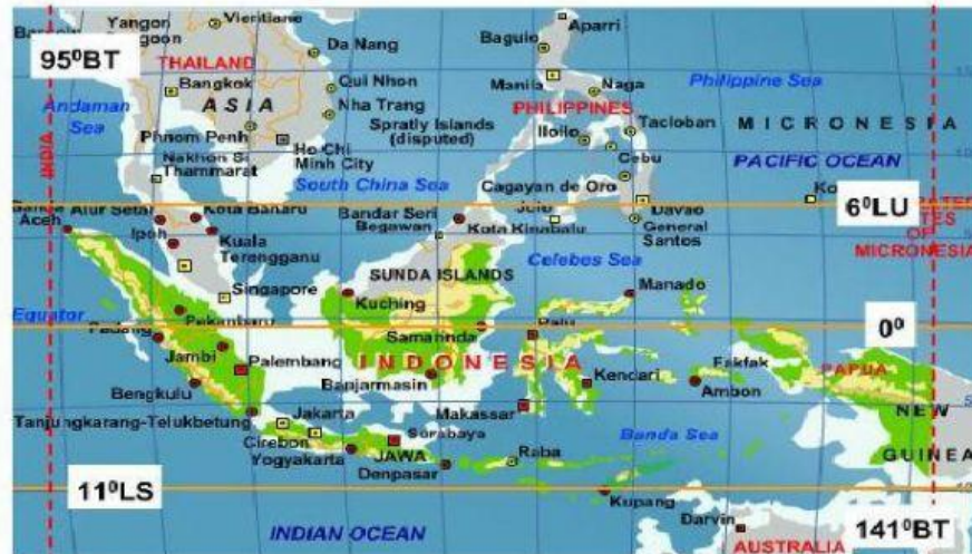
Letak Astronomis Indonesia

Jelaskan pengaruh letak astronomis indonesia terhadap kekayaan sumber daya alam yang di hasilkan didalamnya?